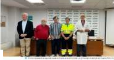
Una familia afectada por el ictus en Zaragoza

Cada 29 de octubre se celebra el Día Mundial del Ictus