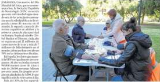
Profesionales y voluntarios informando sobre el ictus y formando la familia para en Zaragoza

La Sociedad Española de Neurología recuerda que es una de las principales amenazas para la salud pública. Es la segunda causa de muerte en el mundo